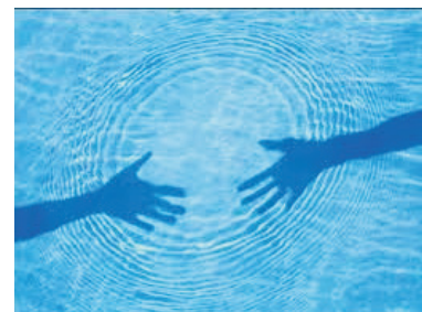
Controlli acqua di piscina

La ns Ditta si presterà a togliere la copertura invernale (dove presente), lavarla e piegarla, effettuare la pulizia dell'acqua ed infine eseguire il trattamento con prodotti chimici necessari per rendere l'acqua nuovamente cristallina e trasparente.